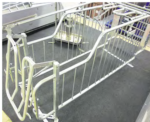
Die Vissing-Agro-Selbstfangbucht ist so entwickelt, dass die Sau selbständig hinein und hinaus kann. Durch die spezielle Hintertür ist die Sau vor anderen Sauen geschützt, sie ermöglicht dem Tier aber dennoch ein einfaches Verlassen der Bucht.

werden. Dieses Zubehör ist eine praktische Lösung auch zum Nachrüsten in Abferkelbuchten und Ferkelaufzuchtställen. Die Kotklappe hat ein Innenmaß von zirka 35,5 cm Breite x 10,5 cm Länge.